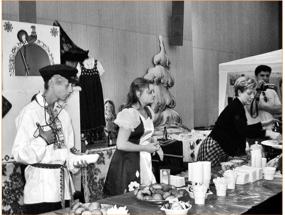
Im Kultur- und Informationszentrum Gera fand ein „Rendezvous der Kulturen“ statt, das einen kleinen Vorgeschmack auf die interkulturelle Woche gab.

Zum 15. Mal fand in Gera die Interkulturelle Woche statt. Bis zum Ende des letzten Jahres lebten 1561 Ausländer und etwa die gleiche Anzahl Spätaussiedler in Gera. Der Anteil der zugewanderten Menschen beläuft sich auf knapp drei Prozent. Ziel der Interkulturellen Woche ist es, unsere ausländischen Mitbewohner, ihre Kultur und Vorstellungen und ihre Meinung kennen zu lernen. Da der tägliche Alltag kaum diese direkte Kontaktmöglichkeit bietet, lud der in Bieblach-Ost ansässige Jugendmigrationsdienst im Rahmen der Interkulturellen Woche zu einem „Tag der offenen Tür“, den die Zuwanderer in Eigenregie gestalteten. Interessierte Einheimische hatten Gelegenheit mit ausländischen Mitbürgern ins Gespräch zu kommen und konnten Speisen aus verschiedenen Herkunftsländern verkosten. Mit der Ausstellung „Wo unsere Wurzeln sind – meine Heimatstadt“ erhielten die interessierten Einheimischen einen kleinen Einblick in das Leben der Zuwanderer.