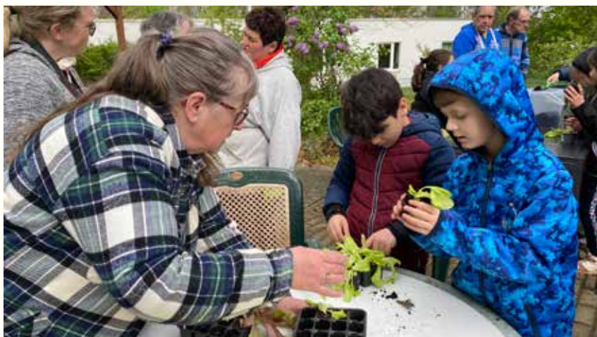
Kinder der Grundschule am Bieblacher Hang sowie die Bewohnenden des AWO Wohn- und Pflegeheims in Bieblach halfen Hand in Hand beim Einpflanzen der Setzlinge für das Gemüsebeet.

Ein ganz großes Dankeschön geht an das Team des AWO Wohn- und Pflegeheimes, das den Kindern und Bewohnern diese wertvolle Begegnung sowie die gemeinsame Aktivität im Freien ermöglicht, vorbereitet und durchgeführt hat. Gern kommen die Schülerinnen und Schüler des „Bieblacher Hangs“ wieder zum Einsatz.