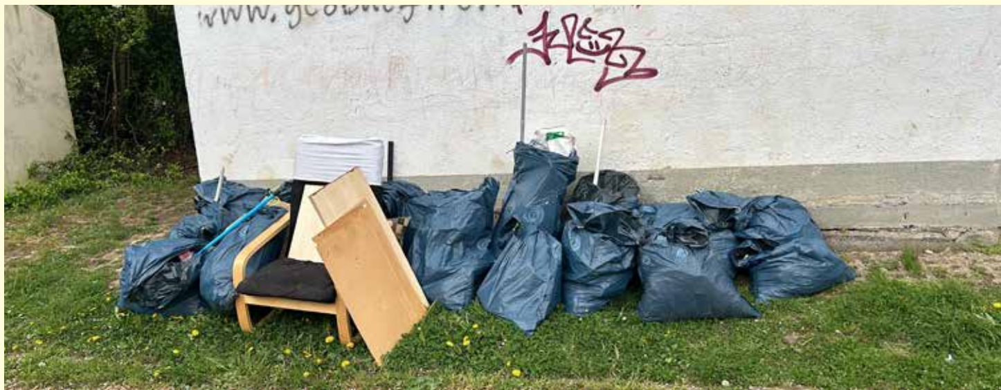
Auch in diesem Jahr waren die Müllsäcke, der am Frühjahrsputz beteiligten, freiwilligen Helfer gut gefüllt.

A uch 2024 beteiligte sich ThINKA Gera am traditionellen Frühjahrsputz. Am 17.04.2024 trafen sich Teams der Projekte ThINKA Gera, AGATHE (beides OTEGAU), Verbraucher Stärken im Quartier (Verbraucherzentrale Thüringen) und die Kolleg:innen aus dem Stadtteilbüro Bieblach-Ost, um Müll und Unrat im Stadtteil zu beseitigen. Im Sinne der Effizienz verteilte man sich auf verschiedene Straßenzüge. Am Ende war der große Container gut gefüllt mit mehreren Schwerlastmüllsäcken und einigem Sperrgut. Konkret wurden zerlegte Schränke in der Natur gefunden, eine TV-Wandhalterung und mehrere Wäscheständer (ohne Wäsche). Kurios: Hinter dem Wohnblock Schwarzburgstraße 12 - 24 liegen auffällig oft halbvoll Gurkengläser. Falls sich jemand ertappt fühlen sollte: bitte in Zukunft die Müllcontainer nutzen!