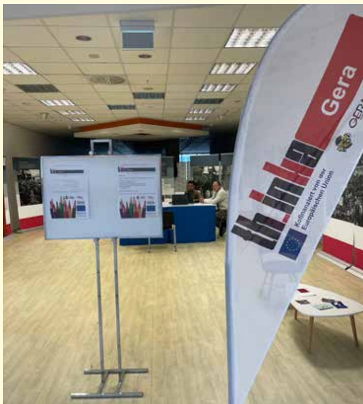
Mitarbeiter des ThINKA-Projekts Gera bei der Beratung von Hilfesuchenden in den Gera Arcaden

Gerne können Sie sich am Dienstag von 14:00 bis 16:00 Uhr im 1. Obergeschoss der Gera Arcaden melden, wenn Sie Fragen haben.