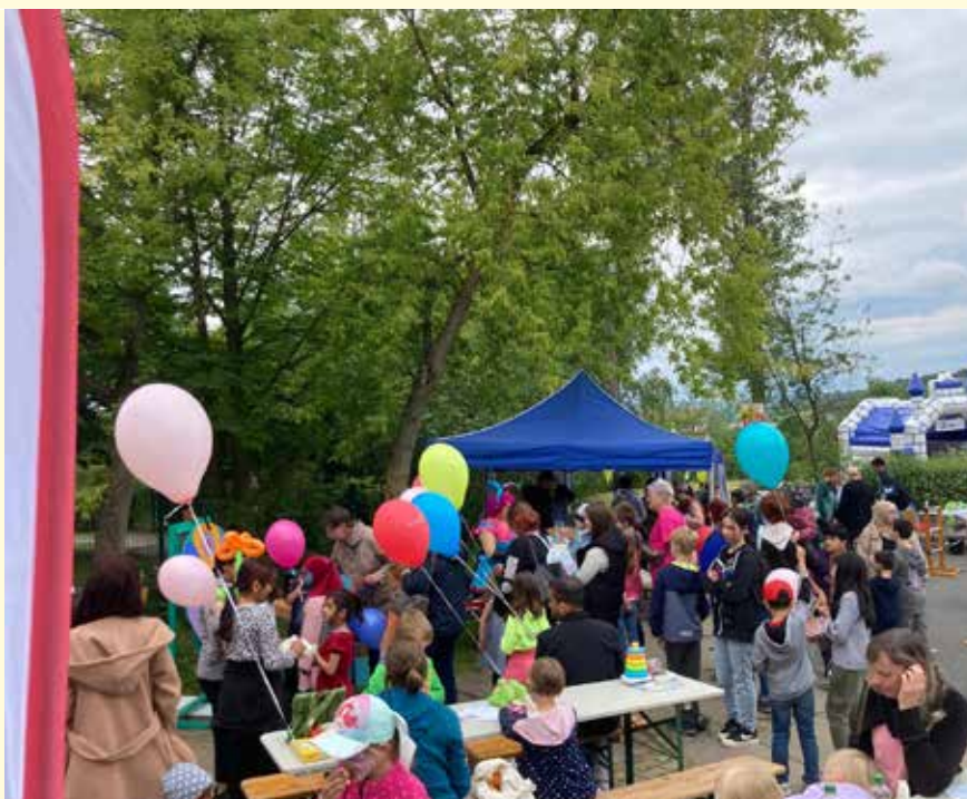
Ein buntes Treiben zum Jubiläum des Familienzentrums im Wendehammer der Fritz-Gießner-Straße in Bieblach-Ost