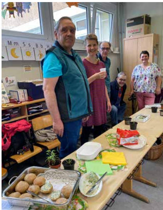
Die geladenen Gäste des Gartenfests waren begeistert von den Leckereien aus dem Gemeinschaftsgarten der Grundschule am Bieblacher Hang

Am 24. Mai war es wieder so weit: Das zweite Gartenfest im Gemeinschaftsgarten Bieblach stand am Nachmittag auf der Tagesordnung. Für das leibliche Wohl war mit selbst gebackenem Kuchen, Zuckerwatte, liebevoll hergestellten Brötchen und Kräuterbutter gesorgt. Kräuterrätsel sowie verschiedene Gemüse-pflänzchen zum Einpflanzen in die Hochbeete standen bereit. Ebenso waren eine Bastelstraße sowie eine Kinderschminkstation organisiert. Einzig das Wetter wollte nun zum wiederholten Male nicht mitspielen.