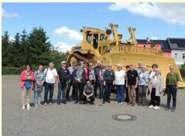
Exkursion nach Ronneburg am 25. Mai. Im Hintergrund eine Planier- raupe, die zur Sanierung des Tagebaus Lichtenberg eingesetzt wurde.

Auch die vom örtlichen Bergbauverein geleitete Exkursion nach Ronneburg brachte interessante Erkenntnisse zutage. Die Neuen Landschaft Ronneburg ist nach den komplexen Sanierungsmaßnahmen nicht nur ein attraktives Naherholungsgebiet für Groß und Klein, sondern zugleich ein Vorbild für Ingenieure aus der ganzen Welt. Darüber hinaus wurden wiederum wichtige Fragen besprochen: Was passierte eigentlich damals mit Schmirchau? Wie können wir mit den Ewigkeitslagen umgehen, die durch den Uranerzabbau entstanden sind? Wo wird die Arbeit der SDAG Wismut in und um Ronneburg überhaupt noch sichtbar?