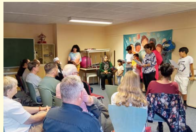
Text deutscher Familienverband Gera, Bilder Stadtteilbüro

Der Text basierte auf einem bereits vor ca. 50 Jahren erschienenen Song, der leider in Vergessenheit geraten ist. Im Anschluss wurde in einer kurzen Ansprache darauf eingegangen, dass eine bunte friedliche Welt nur möglich ist mit gegenseitiger Toleranz, Achtung und Respekt vor fremden Grenzen, Kulturen und Religionen. Besonders im Wohngebiet Bieblach-Ost sollte damit ein Zeichen gesetzt werden für ein buntes friedliches Miteinander, denn trotz vieler unterschiedlicher Nationalitäten gibt es eine Farbe, die alle Menschen verbindet und das ist die Farbe unseres Blutes.