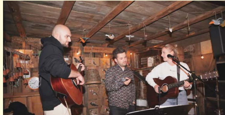
Text und Fotos Wir gehen raus e.V.