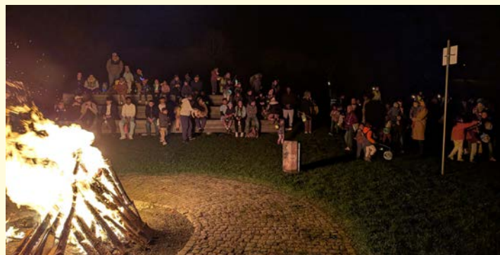
Text und Foto Jugendclub CM

Besonders engagiert waren die Erzieher aus dem Kindergarten Bummi, die mit den Kindern am Lagerfeuer noch das Gute Laune Lied getanzt haben. Nicht nur die Kinder waren begeistert, auch Eltern haben mitgetanzt.