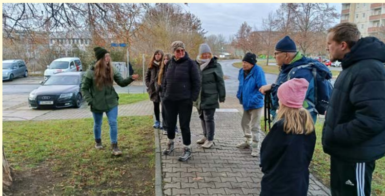
Text und Foto Stadtteilbüro Bieblach

Abschließend gab es dann im Motor Markt bei heißem Tee die Antworten auf nähere Fragen und eine Wunschrunde mit der Stadtteilmanagerin. Danke an die GWB Elstertal für die Verpflegung. Die nächste wildnispädagogische Wanderung wird am 31.03.2026 stattfinden.