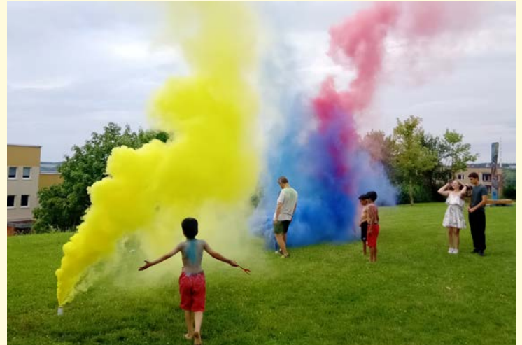
Text und Bilder Stadtteilbüro Bieblach