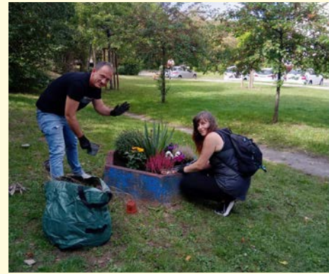
Bilder und Text Stadtteilbüro Bieblach