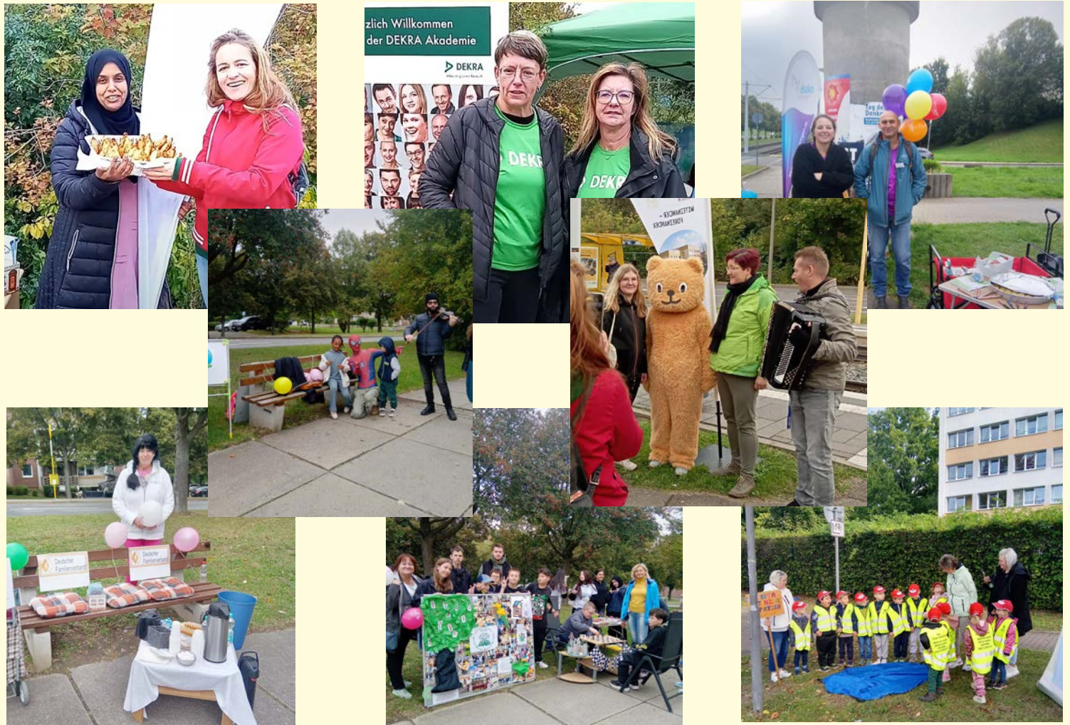
Text und Fotos Stadtteilbüro Bieblach

In Bieblach konnten aufgrund der zahlreichen Organisationen fast alle Haltestellen besetzt werden, so konnte sich das Team Bieblach, mitunter sehr einfallsreich, präsentieren.